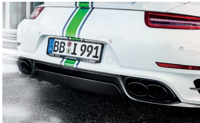
TECHART Heckdiffusor in Kohlefaser und schwarze TECHART Doppelendrohre. TECHART carbon fiber rear diffuser and black TECHART tailpipes.