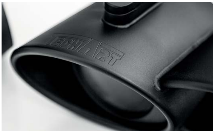
Das typische TECHART Endrohrdesign mit zweiflügligen ovalen Abschlussblenden. The typical TECHART tailpipe design with oval twin exhaust tips.