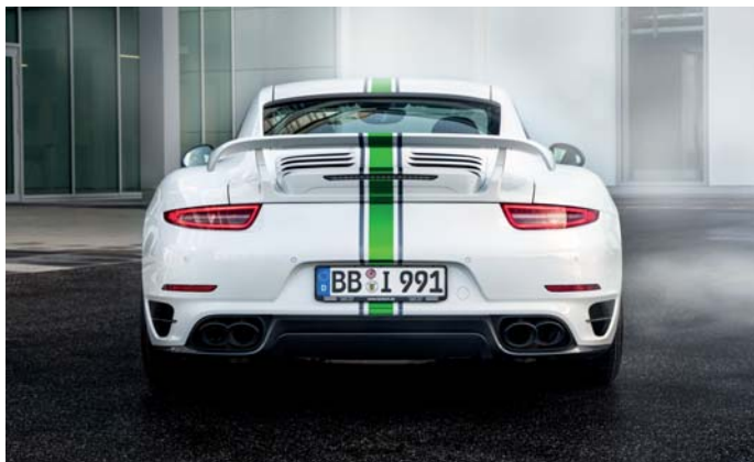
Leistung, im Stand erkennbar: das TECHART Aerokit I mit Carbon-Sportpaket. Power, instantly visible: the TECHART Aerokit I with Carbon Exterior Styling Package.