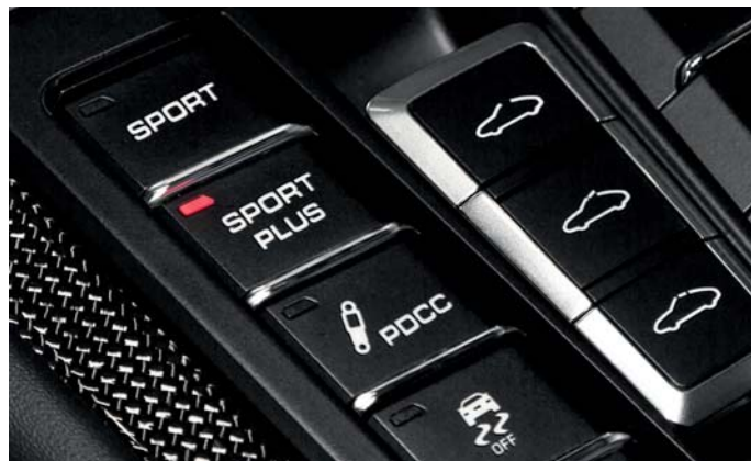
Perfekte Integration. Leistungssteigerung und Klappensteuerung per Tastendruck. Perfect integration. Power boost and exhaust valve control, both at the press of a button.