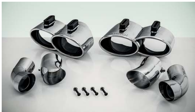
TECHART Sportendrohre, verchromt TECHART sport tailpipes chromed