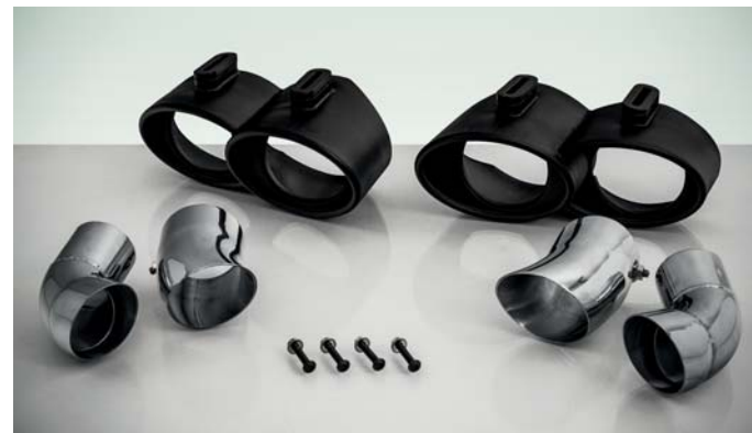
TECHART Sportendrohre, schwarz verchromt TECHART sport tailpipes, black chromed