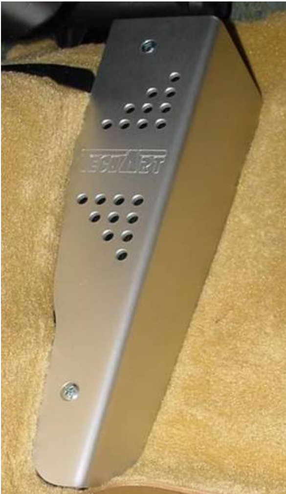
Ausführung Rechtslenker / version RHD